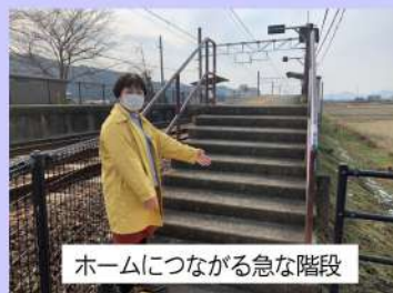
ホームにつながる急な階段

そのため綾部駅まで乗り過して、福知山方面の電車に乗り換え高津駅で下車し帰ってくる。」という内容でした。 こんな苦勞をされていることを知り、なんとか改善できないものかと、要望を市に伝えると、市も把握されており、「JRにも伝えていますが、階