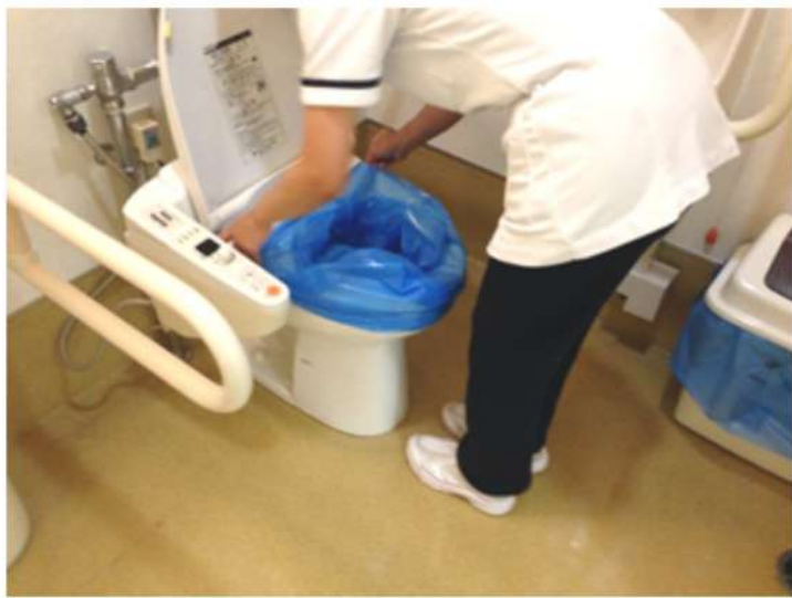
浄化センターに近い病院では、トイレにビニール袋をかけて使用

高津町の下水浄化センターに近い地域では、集中豪雨など水害時に汚水の逆流があり、トイレの使用が出来なくなりますが、この数年間に2回も被害があり、地元でも対策を要望されています。 被害を受けている方々に聞くと、「逆流で、汚水まますの蓋が2mほど持ち上がった」「トイレが逆流のため使用できず、遠くまでトイレ通いをした」「便器にビニール袋で対応した」など大変な苦勞でした。