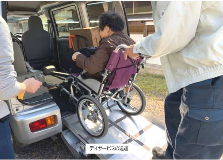
デイサービスの送迎

【市の答弁】国は9段階の保険料だが綾部市は13段階とし、所得水準に応じた保険料に努めている。「コロナによる収入減少等に對して減免制度もある。今度も介護給付費の増大も予想され、全体を見ても活用金を活用する。保険料の決定も総合的に判断したい。」 【市】「介護を社会全体で支える」ためには公的に介護を保障する制度が必要。本来、介護者が介護によって社会的な不利を被ることのないように、仕事も続けられ、余暇も楽しめる支援策が必要。市の考えはどうか。 【市の答弁】介護保険制度20年を経過して、社会全体が高齢者を支えることが根付いた。今後も、誰もが住みやすい、安心して暮らせるまちづくりを目指していく。