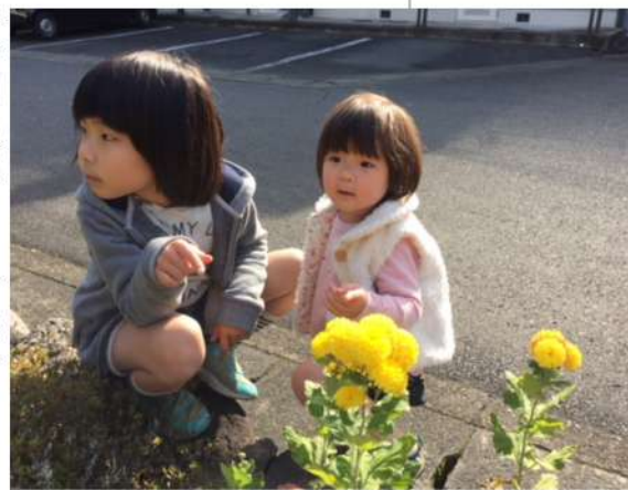
保育料の無料化を (記事とは関係ありません)

【搦頭】国へ要望しているという事は、「低所得者対策が必要」と認めているということ。今ある低所得者へのサービス軽減策は、「軽減」が感じられず、施設入所でも1日1000円、高額介護サービス費も月2万4600円までは支払いが必要。これでは負担