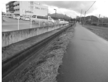
転落事故があった水路。 協立病院東側、府道から北を見る