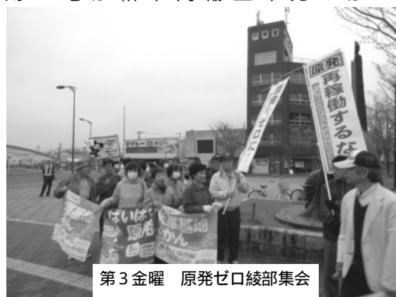
第3金曜 原発ゼロ綾部集会