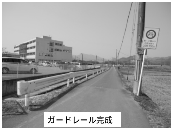
ガードレール完成

京都協立病院東側の水路にはガードレールがなく、誤って転落、骨折するなどの事故がありました。地元自治会のご協力で、綾部市にガードレールをつけてもらいました。