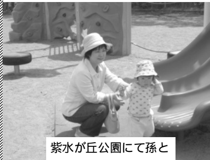
紫水が丘公園にて孫と

「良いことはよい、悪 い事は悪い」とはつき りものを言う日本共産 党を応援していただく ことが、自民党安倍内 閣の暴走をくい止める 力になります。 ご支持ご支援を心よ りお願いいたします。