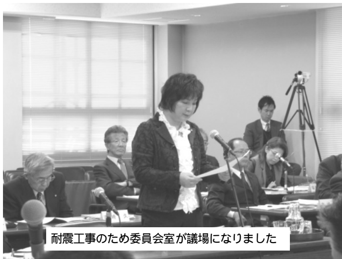
耐震工事のため委員会室が議場になりました