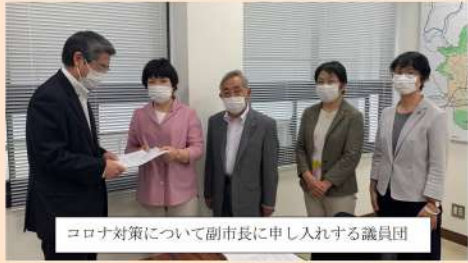
コロナ対策について副市長に申し入れる議員団