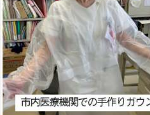
市内医療機関での手作りガウン

【搦頭】市内でも、PCR検査は医師が必要と判断してできなかった経緯がある。病院ではマスク・ガウン等の不足が診療にも影響した。また、コロナ感染症受け入れ病院以外の医療機関でも発熱者に対してはコロナを疑い感染防護体制を取