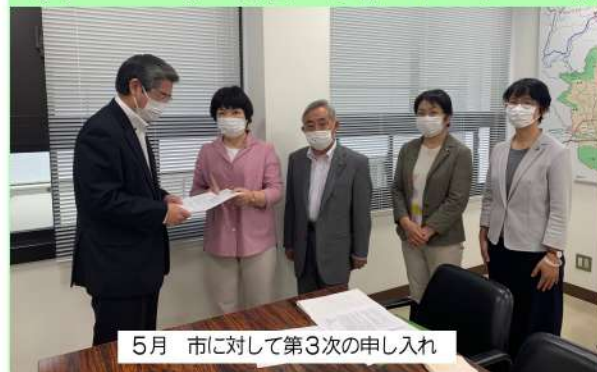
5月 市に対して第3次の申し入れ

【井田】国は感染防止のため、ホテルや旅館の活用を求めているが、全国の自治体では感染の疑いのある軽症者等の避難を想定して、宿泊料を公費負担するところもあるがどうか。