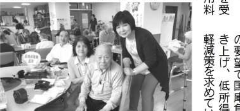
介護サービスを訪問 (記事とは関係ありません)

【質問】地震、台風等の災害は長時間の停電を引き起こす可能性がある。在宅酸素療法や痰の吸引を必要とする方にとって命に直結する問題だ。