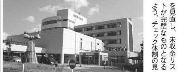
綾部市立病院 直しを医療公社に指示した。

【質問】「債権回収の弁護士事務所から支払済みの医療費の督促状が届き驚いた」と相談があった。市民の申し出により、間違えて請求が行われたことが分かったがなぜ支払ったものが請求されたのか。