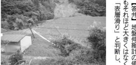
市道高津旭線土砂崩落現場 旭町地内7月7日午後2時撮影

【質問】旭町での土砂崩落は平成25年に続いて二度目。また私市田山古墳の崩落も26年に続いて二度目。なぜ同じ箇所でも土砂崩落が発生したのか。