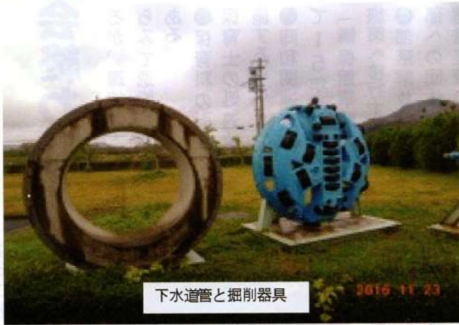
下水道管と掘削器具

財政計画に反映をすべき資産調査はまだできていない。「ビジョン」についてもこれから検討を行う。