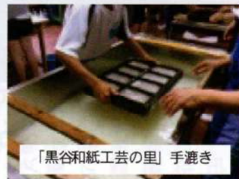
「黒谷和紙工芸の里」手漉き

●消防職員の充足率を 上げること。 ●教職員の多忙化解消 を。 ●学校図書館司書の配 置を。 ●原発再稼働に反対し、 廃炉を求めること。