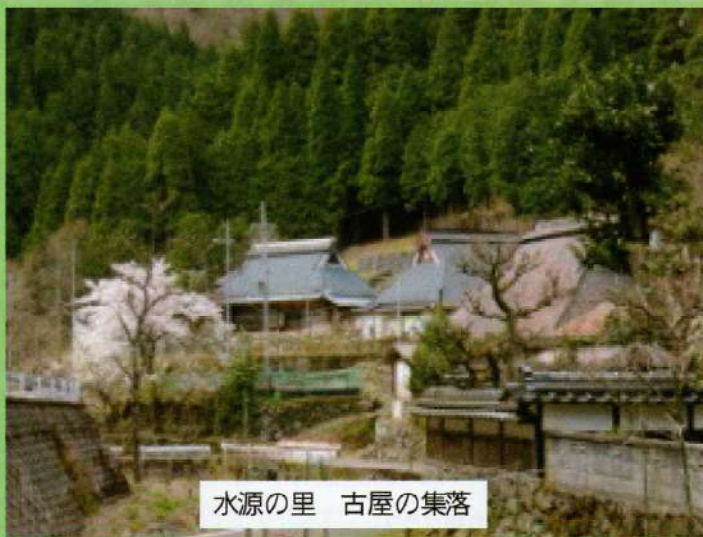
水源の里 古屋の集落

最後に「未来に生きる子どもたちに自信と誇りをもって水源の里を引き継いでいく」という大会アピールを参加者全員で確認しました。