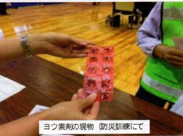
ヨウ素剤の現物（防災訓練にて）