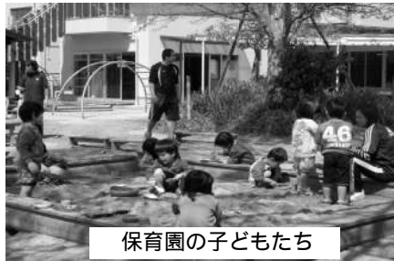
保育園の子どもたち

今年4月、消費税を8%に引き上げた際、都道府県税である普通自動車取得税は税率を引き下げた。これにより、地方自治体の税収は減収になったが、その補て