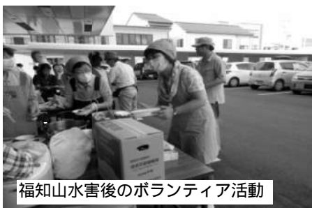
福知山水害後のボランティア活動

【質問】 京都府が子どもの医療費助成の拡充を検討しているが、それに合わせて本市の中学校の通院まで助成できないか。 【答弁】 京都府の推移を見ていきたい。