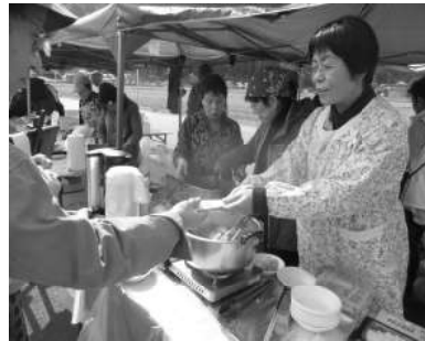
平和健康祭りにて

久しぶりに大なべでこんにゃくを炊き上げました。大根、ジャガイモ、卵など6種類それぞれの家の味が相乗効果で、100人分のおでんはすぐに売り切れとなりました。